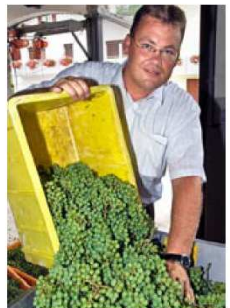
MATHIER LIESS DIE TRADITION DES VERJUS WIEDER AUFLEBEN Die grünen Trauben werden gepresst und in der Spitzengastronomie wie Essig verwendet.

► VINEA IN SIERRE, 6. UND 7. SEPTEMBER 2008 Das grosse Fest des Weines feiert seinen 15. Geburtstag. 1200 Weine werden in der Avenue Général Guisan präsentiert.